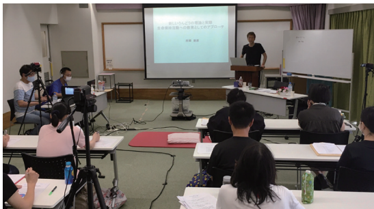
講師より直接講義を受けることができます