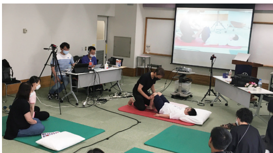
目と耳で実践を体感します