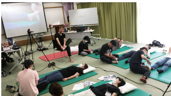
二人組でペアになり触れられる体験をします