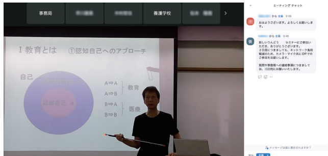
講師の表情や発言を共有して臨場感を高めています